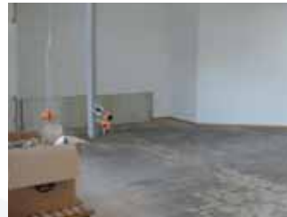
... während des Umbaus ...