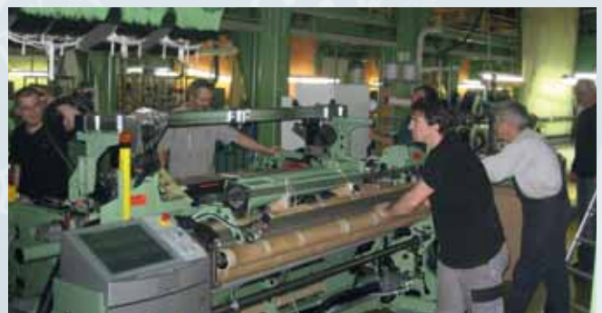
Neuen Webmaschinentyp in Betrieb genommen