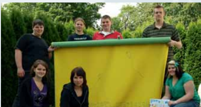
Kindergarten Marlesreuth ausgestattet