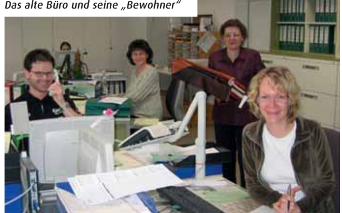
Das alte Büro und seine „Bewohner“

Durch den Umzug der Möbelstoffrollen erzielen wir eine deutliche Zeitersparnis. Es entfällt das Warten auf den Aufzug, das Aufzufahren und der Weg über die Rampe.