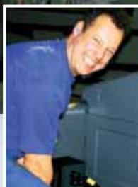
Nach getaner Arbeit konnte man gut lachen

Zu den neuen Jacquardmaschinen wurden uns auch neue Webmaschinen des auf der ITMA 2007 vorgestellten Typs PTS 8/J C von Dornier geliefert. Von der Arbeitsweise der Webmaschine hat sich nichts geändert, aber die komplette Elektronik und die Bedienelemente wurden neu gestaltet. Der Antrieb ist ein Kompaktantrieb, der neue, große Schaltschrank fällt sofort auf.