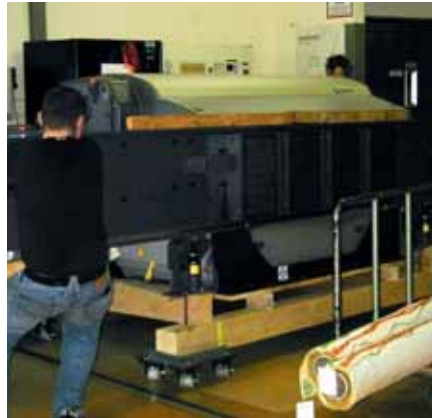
Jacquardmaschine LX 3202

Diese Ausrüstung erfolgt in einem sogenannten Tumbler, einer Trockenmaschine mit rotierender, perforierter Trommel, die das Material umwälzt. Dabei erfährt der Stoff zur Erzielung eines weichen Warengriiffs eine intensive Walkbehandlung, die durch feuchte, warme Luft und das Einblasen von Wasserdampf noch unterstützt wird. Durch die hohe mechanische Beanspruchung bei diesem Ausrüstungsgang ist im Vorfeld besonders auf eine feste Leistenbindung und gut eingebundene Dreherfäden zu achten, um ein Herauslösen der äußeren Kettfäden aus dem Gewebe zu vermeiden.