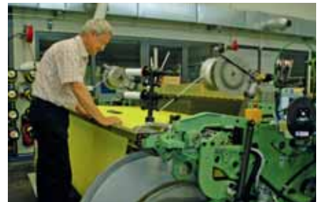
Interessant auch die Luftdüsenwebmaschine ohne Kettfadenwächter. Hier wird Filtergewebe hergestellt. Die Kettfadenüberwachung erfolgt über Lichtschranken.