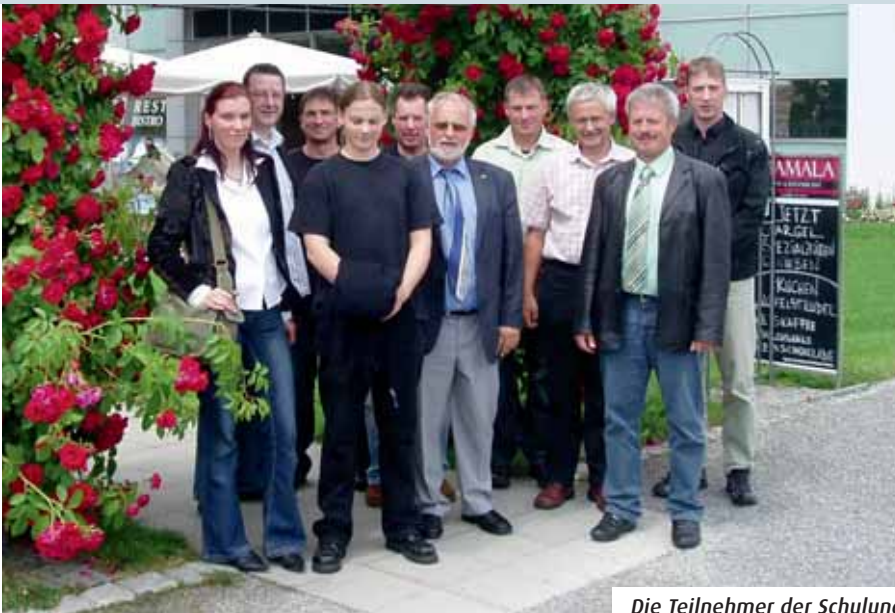
Die Teilnehmer der Schulung