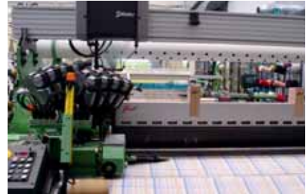
Die Luftdüsenwebmaschine mit eingewebten Namen in der Leiste.