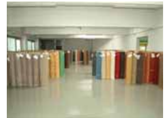
... und jetzt kaum wieder zu erkennen.