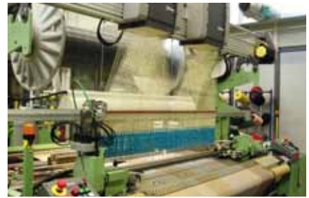
Die neue Easyleno Technologie mit 2 kleinen Stäubli-Jacquardmaschinen.