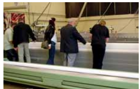
Anschließend wurden uns noch im alten Verkaufsraum Webmaschinen zur Herstellung von technischen Geweben gezeigt, unter anderem eine 5 mtr. breite Maschine mit durchgehendem Kettbaum.