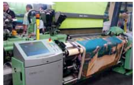
Auf einer sehr dichten Kette wurde ein Bild der Chinesischen Mauer, 140 cm über die ganze Breite, gewebt.